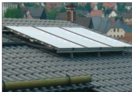
Capteurs solaires sur le toit, centrale de chauffe dans la maison.