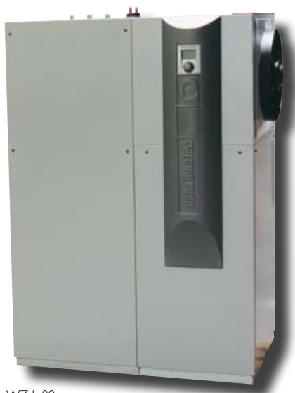
WZ L 80