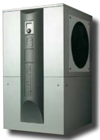
Pompe à chaleur Air/Eau, installation intérieure (LW 190M-I)